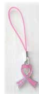
ピンバッチ& ストラップ 各500円(税込)