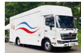
※当日の乳がん検診はかながわ活動推進基金21の対象事業です。