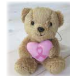
リボンベアー 600円(税込)