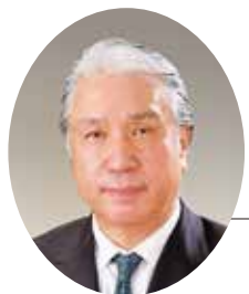
横須賀ロータリークラブ 会長