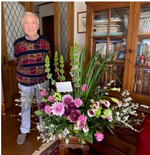
1978年3月24日1332回週報より

全10ページ Member's ROOMに掲載してあります。(ロータリーの絆、また横須賀の歴史を感じます。)